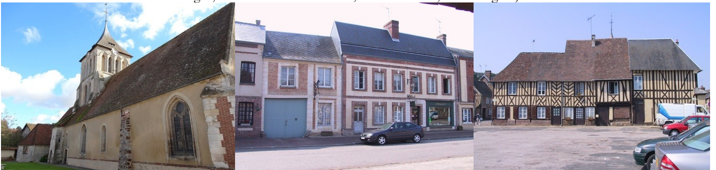
Les abords du monument

Les avis seront cohérents avec ceux émis ces dernières années, à savoir : pas de maisons à volume compliqué (type V, W, Y, ou Z), pentes à 45° pour les volumes principaux, ardoise ou tuile plate de teinte brun vieilli, à 20u/m², avec un débord de toiture de 20cm, enduit de teinte beige clair avec modénatures (au choix : chaînages, encadrement de fenêtres, soubassement, colombage...). *Voir les autres fiches.