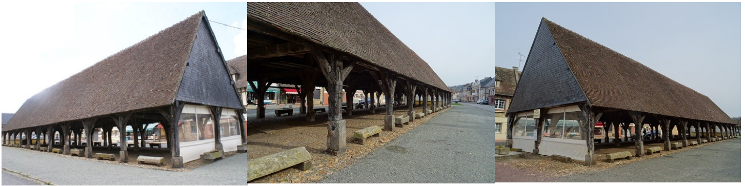
Les halles de la Ferrière